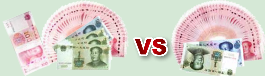
积享存 C-2 到期利息