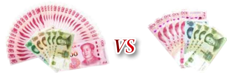
如意存C-1提前支取利息