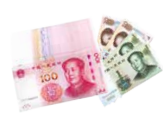
传统5年定期提前支取利息