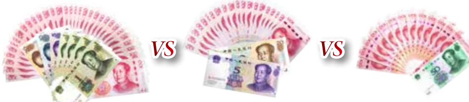
如意存C-2提前支取利息