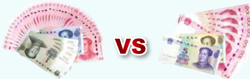
积享存 C-2 提前支取利息