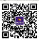
扫一扫关注唐山银行 查询积分余额

唐山银行为客户提供便利，新增营业网点积分兑换业务；积分线上线下都能用，送货上门，方便快捷！ 大部分市区支行均可通过积分换购米面油、日用百货等商品。具体积分线下兑换支行明细见下表。