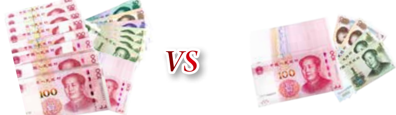
如意存A-4提前支取利息