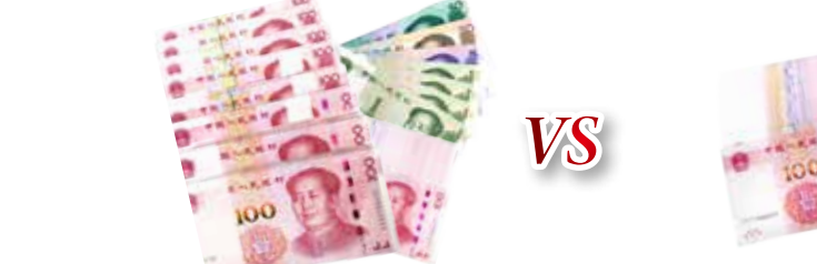
传统3年定期提前支取利息