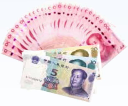
约享存 B-a 利息 ( 2835 元 )