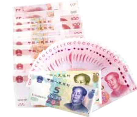
约享存 B-c 50 个月利息 ( 93125 元 )

如您手中有一笔50万元的闲置资金，预计4年左右不会使用，那么您可选择办理“约享存B-c”产品。此产品存期为50个月（4年零两个月），到期利率为4.47%，在存续期内，我行还给予您两次提前支取的机会，即存满18个月（1年半）或37个月（3年零1个月）后一月内，您可根据资金需求办理提前支取，提前支取的对应利率分别为3.8%和4.27%。 因此，当您的资金将闲置4年左右时，选择办理“约享存B”系列产品最为合适。