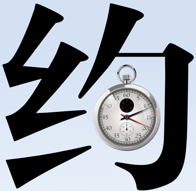
唐山银行“约享存 A”系列个人协议存款产品

存款计息规则： 存期满该产品固定期限，按照约定的存款利率计息；超过该产品固定期限，则超出固定期限的存款将按照同期我行活期存款利率计息。存期末满该产品固定期限，发生提前支取的，产品存续期间，在约定月份支取，则可享受与该选择相匹配的存款利率（具体参照下表，其中在选择期的第一天直至选择期实际支取日期间的存款利率按照我行活期存款利率执行），否则在除存款期满的其他任一时间内发生提前支取的，提前支取部分均按照结息日对应的我行活期存款计息。