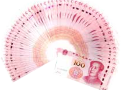
约享存 A-c 利息 ( 7000 元 )