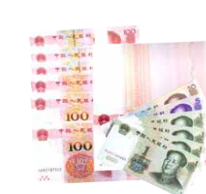
约享存 B-c 37 个月利息 ( 65829 元 )