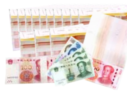
约享存 C-c 35 个月利息 ( 1318333 元 )