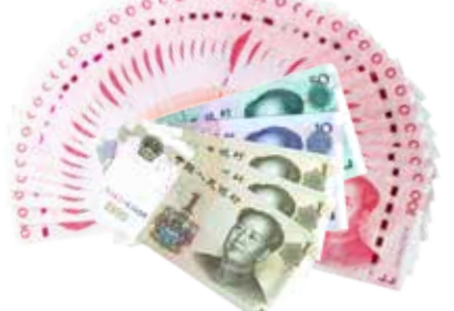
约享存 A-b 利息 ( 4063 元 )