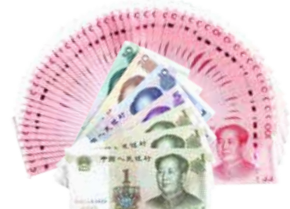
传统 3 年定期利息 ( 6188 元 )

如您手中有一笔5万元资金，预计3年左右不会使用，那么您可以选择“约享存B-b”产品和“约享存A-c”产品，以上两产品可分别在存满37个月（3年零1个月）及40个月（3年零4个月）后的一月内进行支取，对应的利率均为4.2%，对应收益分别为6475元和7000元；目前，我行3年期定期存款年利率为4.125%，5万元3年后的到期收益仅为6188元，与“约享存”存款产品相比，收益至少相差287元。 因此，当资金超过5万元且3年左右不会使用时，选择“约享存B-b”和“约享存A-c”产品最为合适。