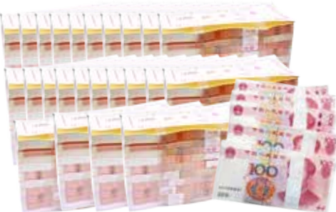
约享存 C-c 60 个月利息 ( 245 万元 )

如您手中有一笔1000万元的闲置资金，预计五年内不会使用，那么您可选择办理“约享存C-c”产品。此产品存期为60个月（5年），到期利率为4.9%，在存续期内，我行还给予您两次提前支取的机会，即存满23个月（2年差1个月）或35个月（3年差1个月）后一月内，您可根据资金需求办理提前支取，提前支取的对应利率分别为4.15%和4.52%。 因此，当您的资金将闲置5年左右时，选择办理“约享存C”系列产品最为合适。