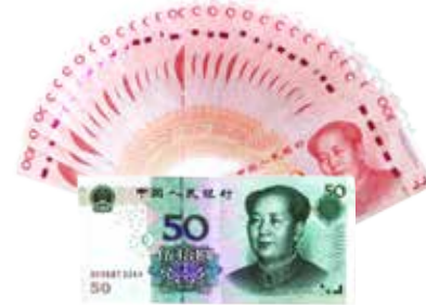
传统 2 年定期利息 ( 3150 元 )

如您手中有一笔5万元资金，预计2年左右不会使用，那么您可以选择“约享存C-a”产品和“约享存A-b”产品，以上两产品可分别在存满23个月（2年差1个月）及25个月（2年零1个月）后的一月内进行支取，对应的利率分别为3.8%和3.9%，对应收益分别为3642元和4063元。目前，我行2年期定期存款年利率为3.15%，5万元2年后的到期收益仅为3150元，与“约享存”存款产品相比，收益至少相差492元。 因此，当资金超过5万元且2年左右不会使用时，选择“约享存C-a”产品和“约享存A-b”产品最为合适。