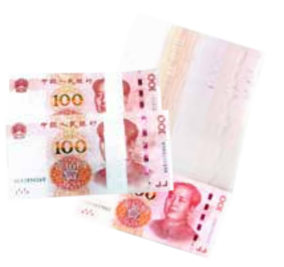
约享存 B-c 18 个月利息 ( 28500 元 )