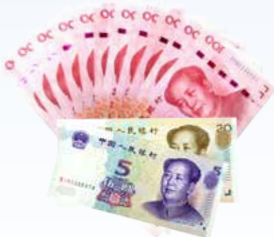
传统 1 年定期利息 ( 1125 元 )

如您手中有一笔5万元的闲置资金，预计1年至1年半的时间内不会使用，那么您可以选择“约享存A-a”产品和“约享存B-a”产品，以上两产品可分别在存满13个月（1年零1个月）及18个月（1年半）后的一月内进行支取，对应的利率分别为3.65%和3.78%，对应收益分别为1977元和2835元；目前，我行1年期定期存款年利率为2.25%，5万元1年后的到期收益仅为1125元，与“约享存”存款产品相比，收益至少相差852元。 因此，当资金超过5万元且1~1年半时间内不会使用时，选择“约享存A-a”产品和“约享存B-a”产品最为合适。