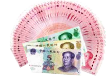
约享存 B-b 利息 ( 6475 元 )