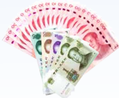
约享存 A-a 利息 ( 1977 元 )