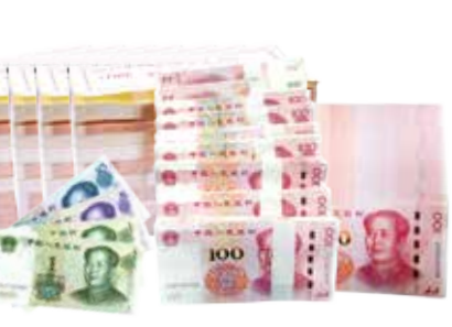
约享存 C-c 23 个月利息 ( 795417 元 )