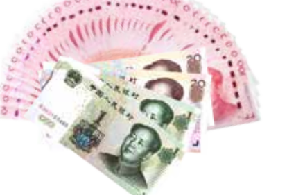
约享存 C-a 利息 ( 3642 元 )